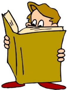
leer un libro