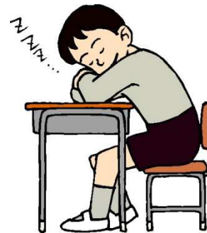
dormir en clase