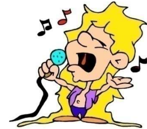
cantar una canción