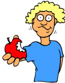
comer una manzana