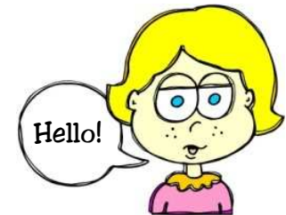
hablar en inglés