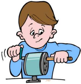
sacarle punta a mi lápiz

B : ¡Sí, por supuesto! (Yes, of course!) #3